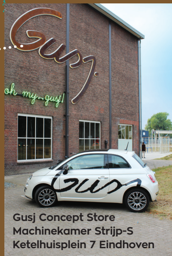
Gusj Concept Store Machinekamer Strijp-S Ketelhuisplein 7 Eindhoven